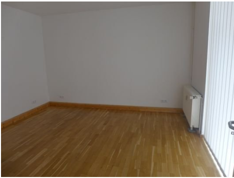
Zimmer 2 im EG.JPG