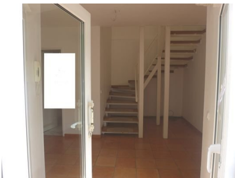
Eingangsbereich im EG.JPG