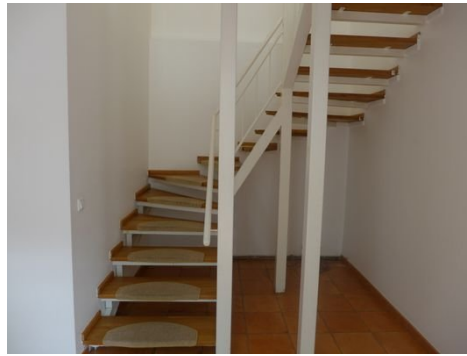
Treppe zum 1. OG.JPG