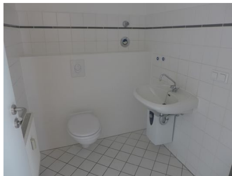
WC im EG.JPG