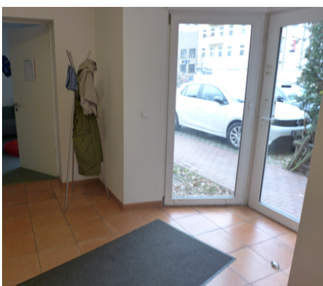
Eingangstür im EG.png