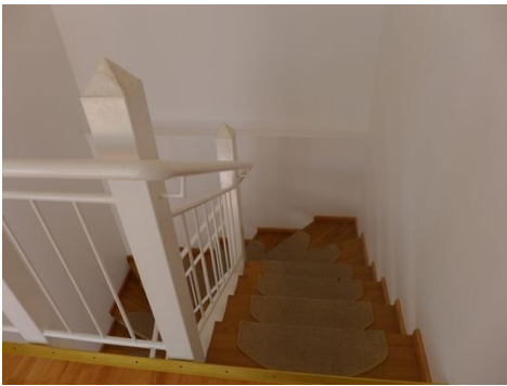
Treppe vom 1. OG zum EG.JPG