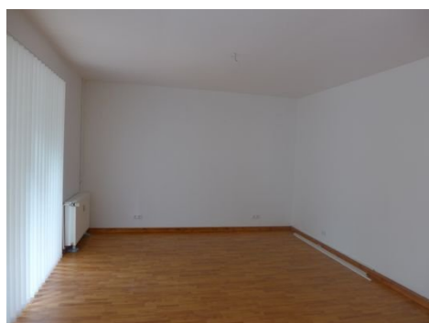
Zimmer 1 im EG.JPG