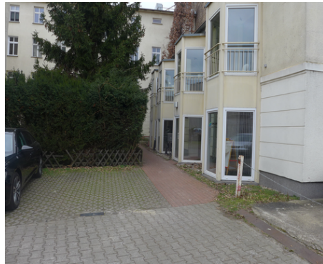
PKW-Stellplätze im Hof.png