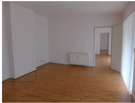
Zimmer 3 im 1. OG.JPG