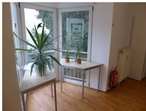
Räume im 1. OG.JPG