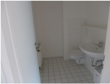
WC im 1. OG.JPG