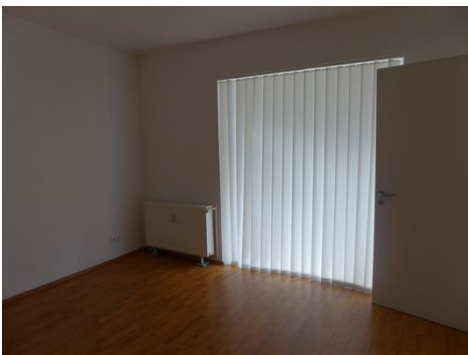
Zimmer 4 im 1. OG.JPG