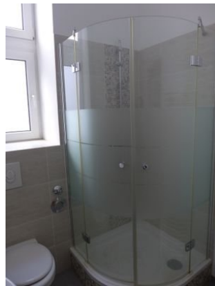
D-Bad Bild 2.JPG