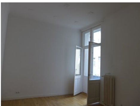
Zimmer mit Balkon B. 2.JPG