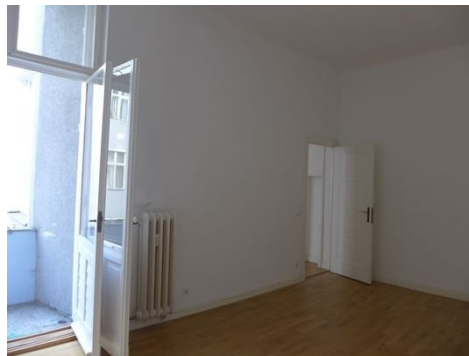
Zimmer mit Balkon B.1.JPG