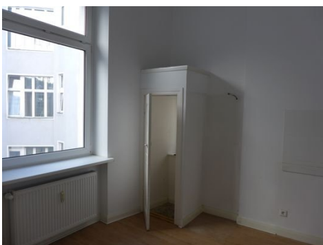
Küche mit Kammer.JPG