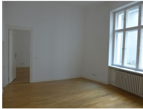
Durchgangzimmer B. 1.JPG