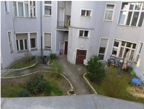
Blick vom Balkon.JPG