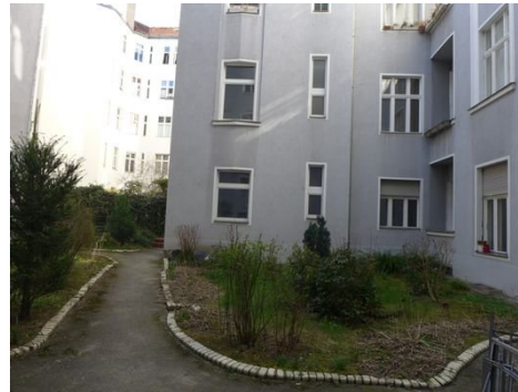
Weg zum Hinterhaus.JPG