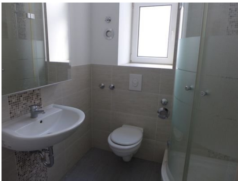
D-Bad Bild 1.JPG