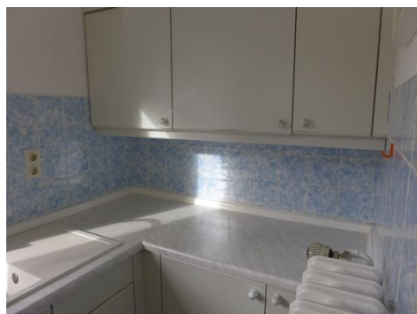
EBK Bild 1.JPG