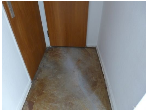
Boden im Flur.JPG