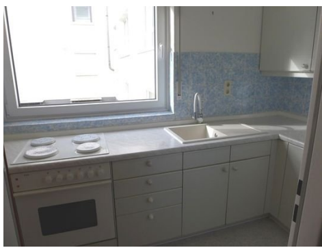
EBK Bild 2.JPG