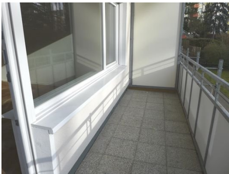
Balkon zur Hofseite.JPG