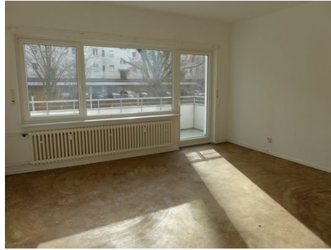
Zimmer Bild 1.JPG