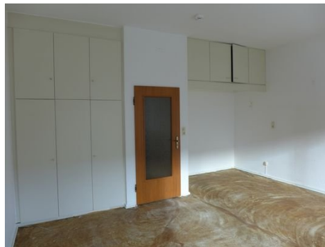
Zimmer Bild 2.JPG