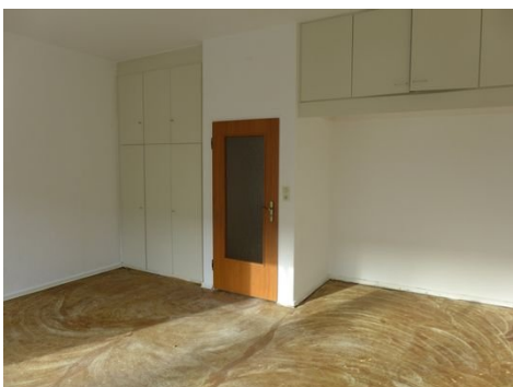
Zimmer Bild 3.JPG